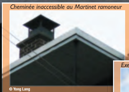
Cheminée inaccessible au Martinet ramoneur