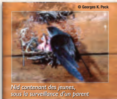
Nid contenant des jeunes, sous la surveillance d'un parent

Contrairement à l'étourneau ainsi qu'aux autres oiseaux, le martinet ne se perche pas sur les branches d'arbres. Aussi, le bec de l'étourneau est visible alors que celui du martinet n'est pas apparent. Enfin, le martinet colle son nid en forme de demi-soucoupe directement sur la paroi interne de la cheminée, alors que l'étourneau dépose son nid sur une surface horizontale à l'intérieur d'une cavité.