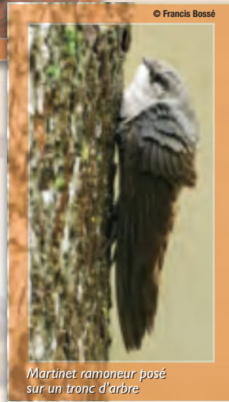
Martinet ramoneur posé sur un tronc d'arbre