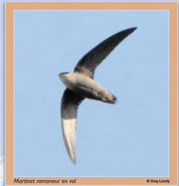
Martinet ramoneur en vol