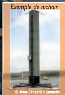
Exemple de nichoir